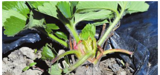
När plantan sitter för högt blir rothalsen frilagd ovanför jordytan.

99 Nummer ett för att lyckas är att sätta sina planter soligt, varmt och luftigt.