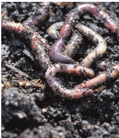
Mask – viktigt för en frodig växtlighet.