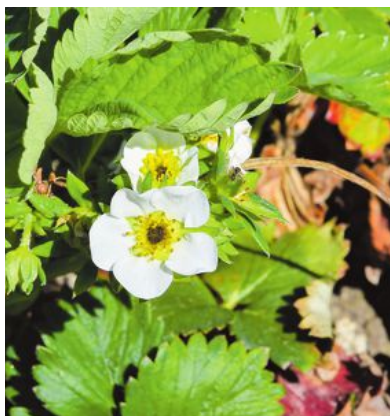
Byt ut plantbeståndet efter fyra, fem år.

med fibrer, järn och antioxidanter, enligt Bärfrämjandet. (TT)