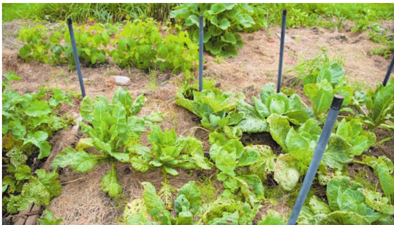
Vid täckodling skyddas rabatten med ett tjockt lager organiskt material.