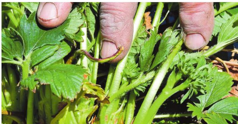
Rothals med nya sidskott. I bladvecken bildas blomställningen som syns nedanför högrea fingrets nagel.