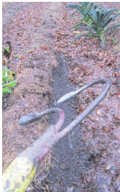
Börje luckrar sina sårader försiktigt.