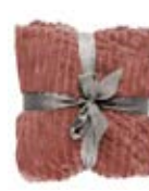
Fleecefilt 44-3789-6, 149,90 kr