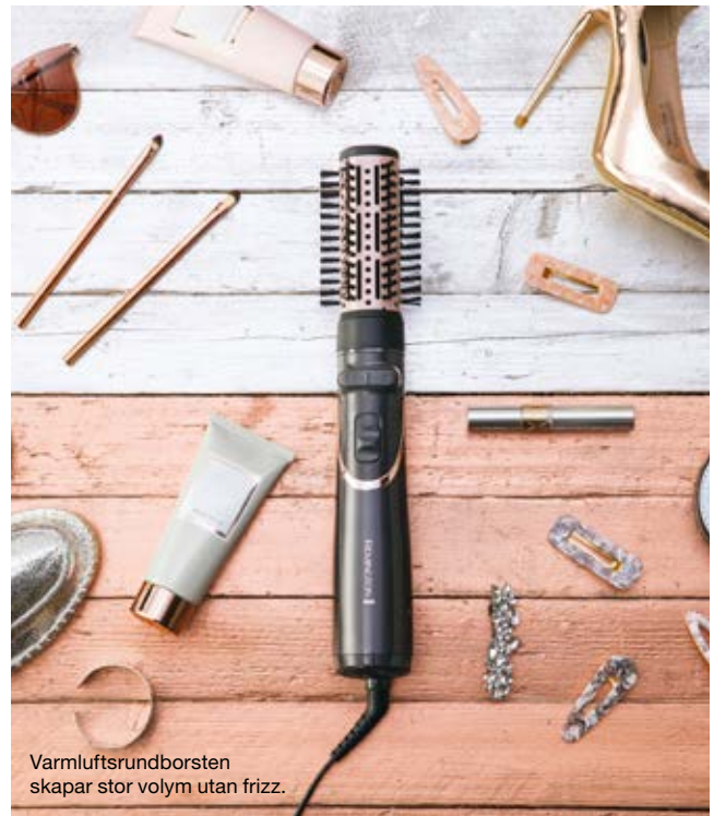
Varmluftsrundborsten skapar stor volym utan frizz.