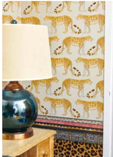
Bevarade 60-talsdetaljer i trappen, Nassims egenskapade baryton-lampa i sonens rum och riviga leopardtapeter i hallen.

altan framöver. En plats som har kommit att bli hela familjens favorithäng under sommaren.