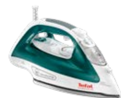
Tefal Ultraglide Strykjärn 44-9019-2