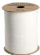
Presentsnöre 44-4372, 19,90 kr