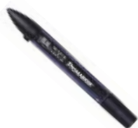
Tuschpenna Winsor & Newton ProMarker 44-1651-24 39,90 kr