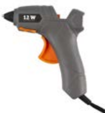
Limpistol, grå 41-1350, 59,90 kr