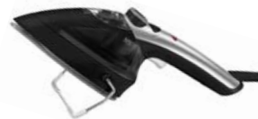
Tefal Tweeny Nano Steamer 44-3782