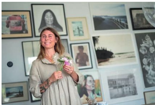
Överallt i Kristins hem syns spår av hennes kreativitet.