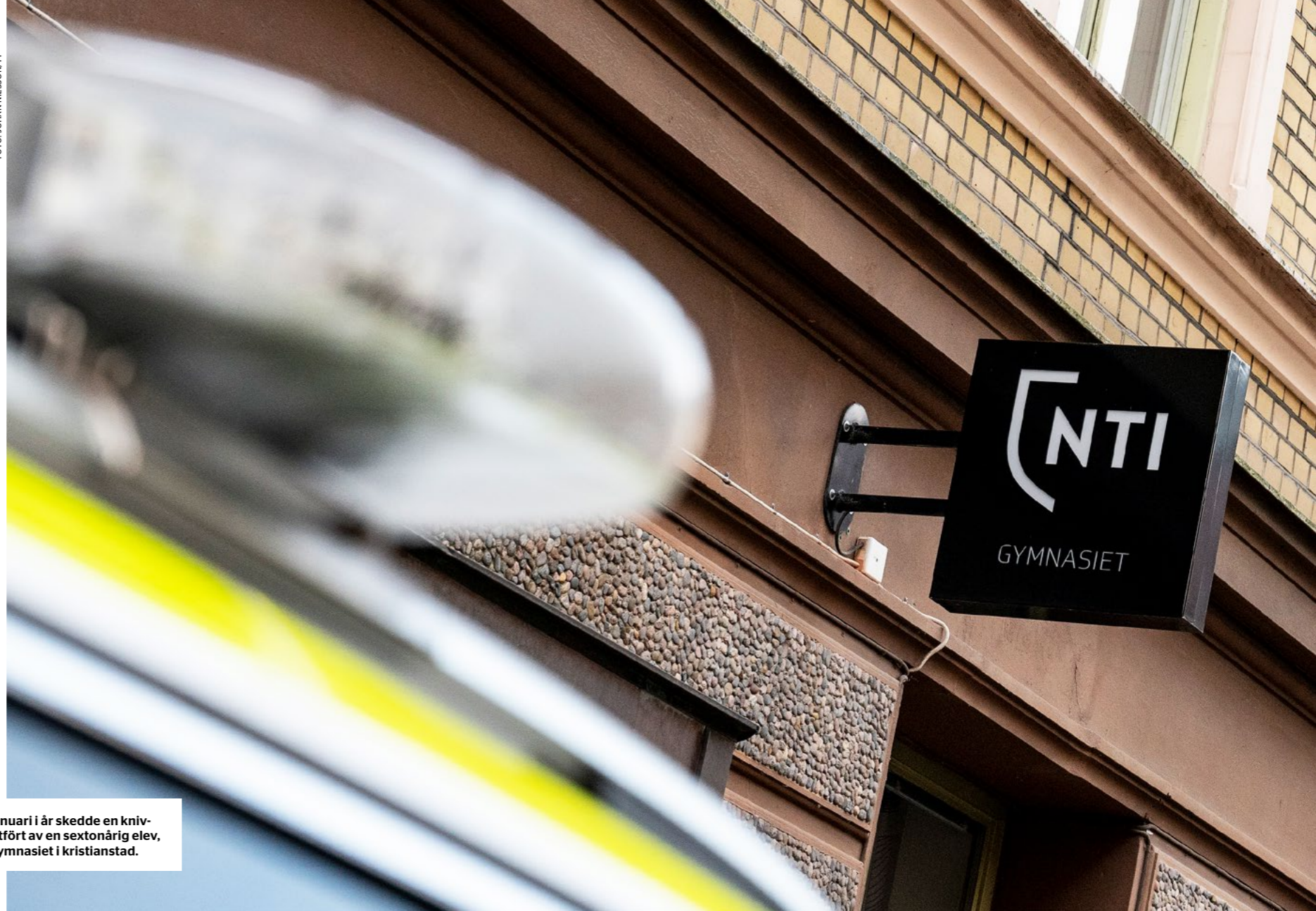
Den 10 januari i år skedde en knivattack, utförd av en sextonårig elev, på NTI-gymnasiet i Kristianstad.

” Om du måste ta skydd är det viktigt att komma ihåg att stänga av ljud och ljus på mobilen.